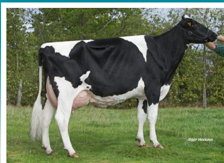
G2 GALAWAY, madre de Input