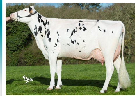
ROZA ELIZA, madre de Gelizat