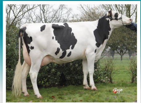
CARAIBE, hija de Atribus